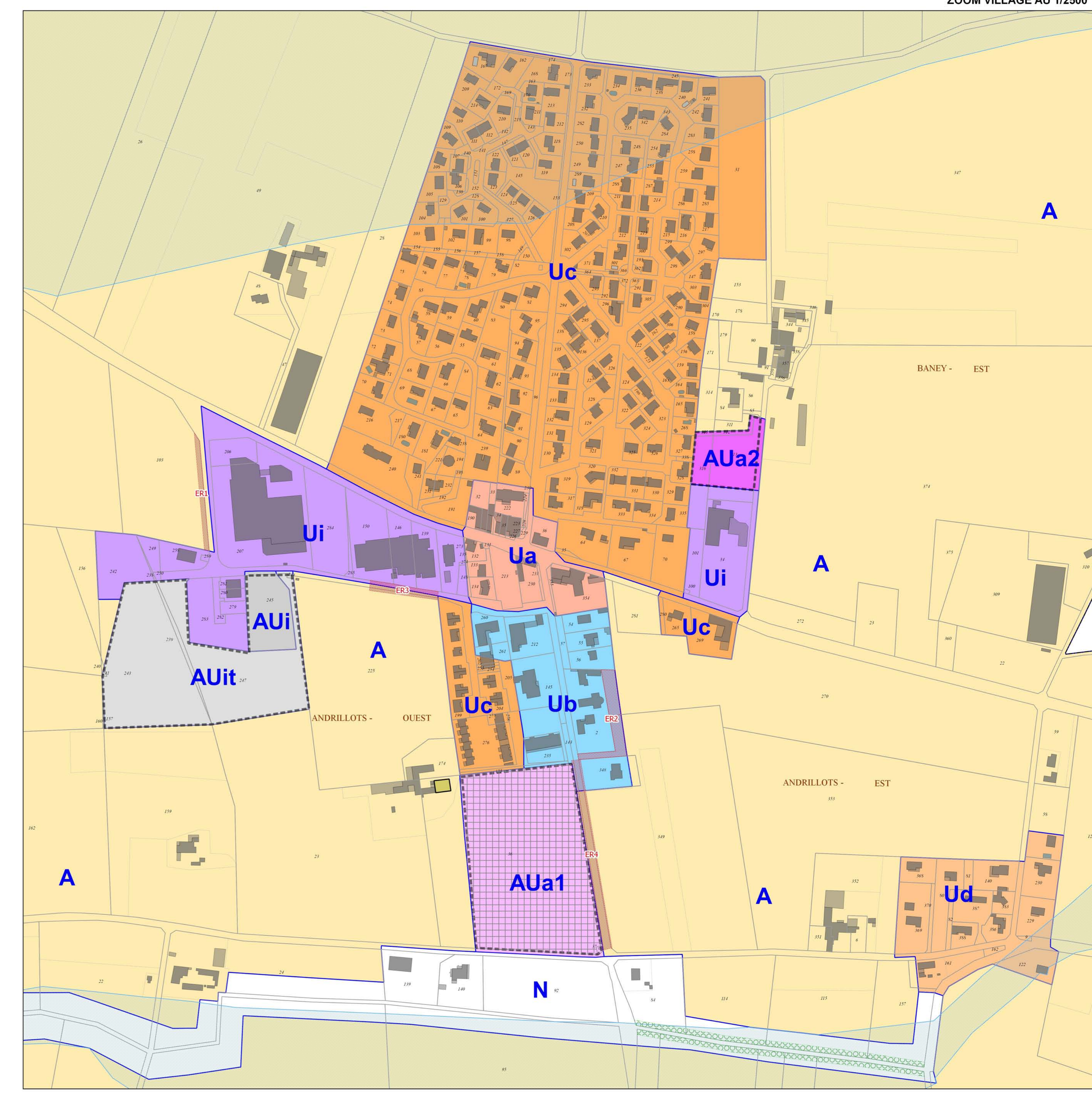
ZOOM VILLAGE AU 1/2500