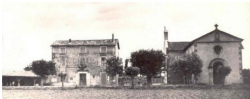
Le bâtiment en 1948.

L'ancienne mairie, l'un des bâtiments les plus emblématiques de notre village, tour à tour, école communale puis mairie, construite au début du siècle dernier, est chère au cœur de nombreux grangeois qui ont pu y étudier avant l'ouverture de la nouvelle école en 1966, salle des mariages jusqu'en 2006.